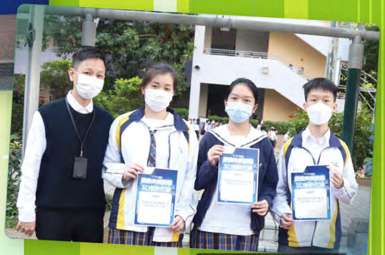
校長與得獎同學合照